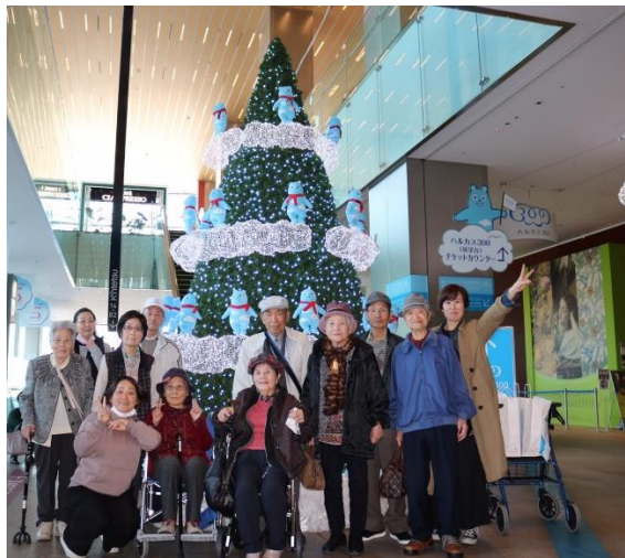
秋の遠足 (あべのハルカス)