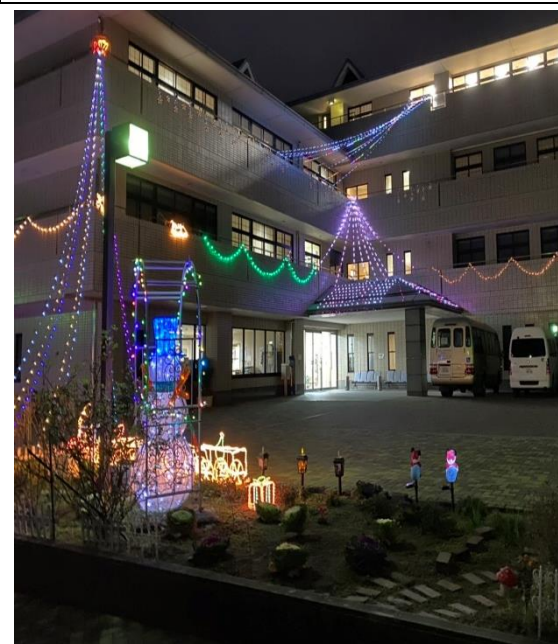
冬季イルミネーション