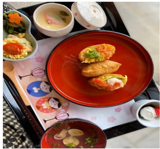
ひな祭りメニュー