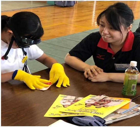
「職業人と語ろう」別府西小学校