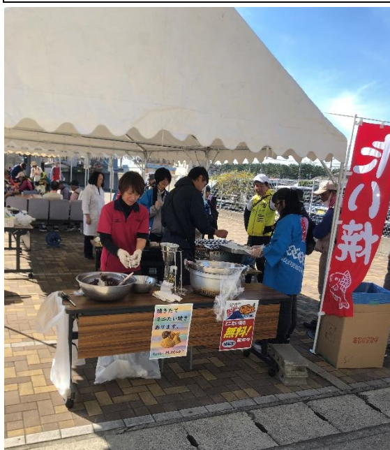
加古川市ツデーマーチ