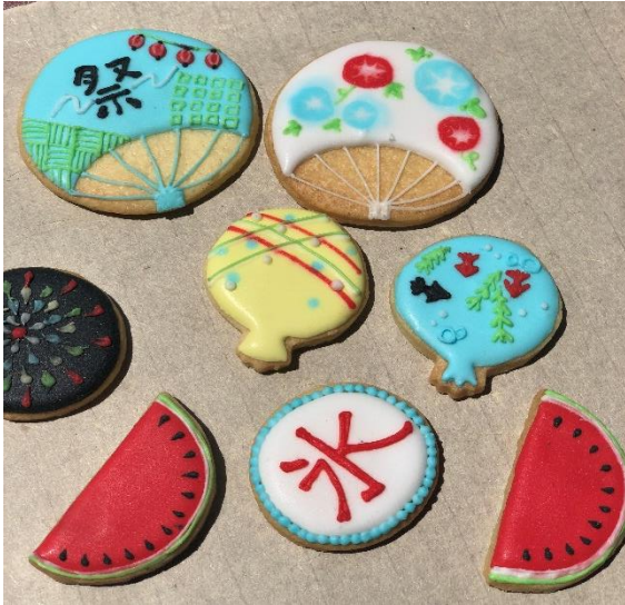
アイシングクッキー作り