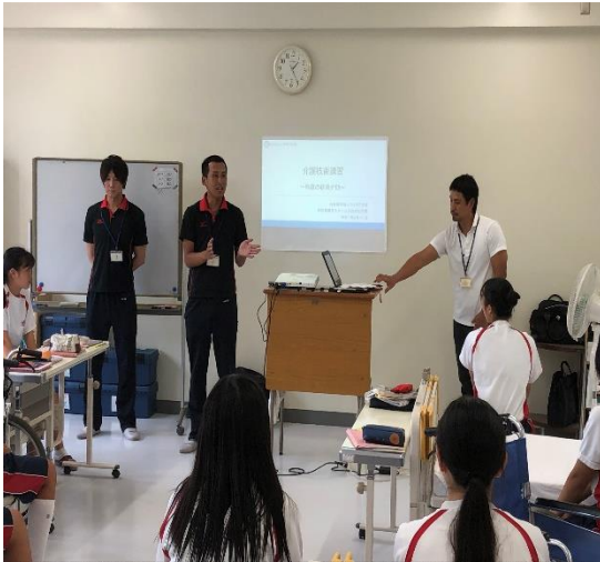
「出前授業」加古川南高校