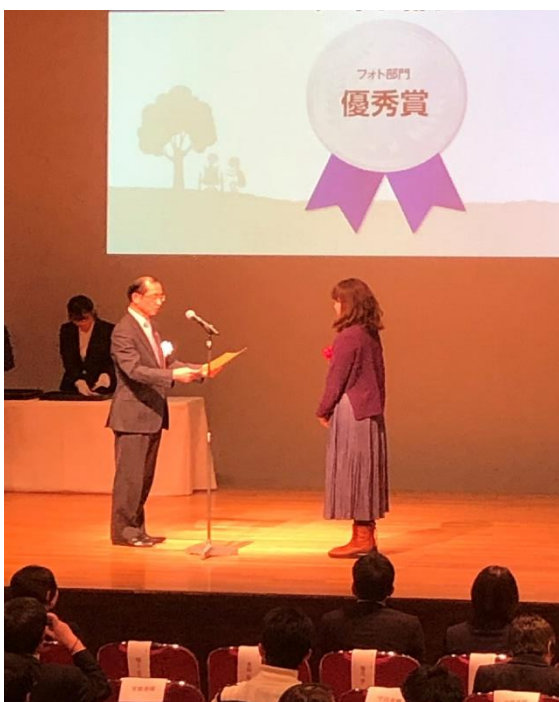
フォトコンテスト授賞式